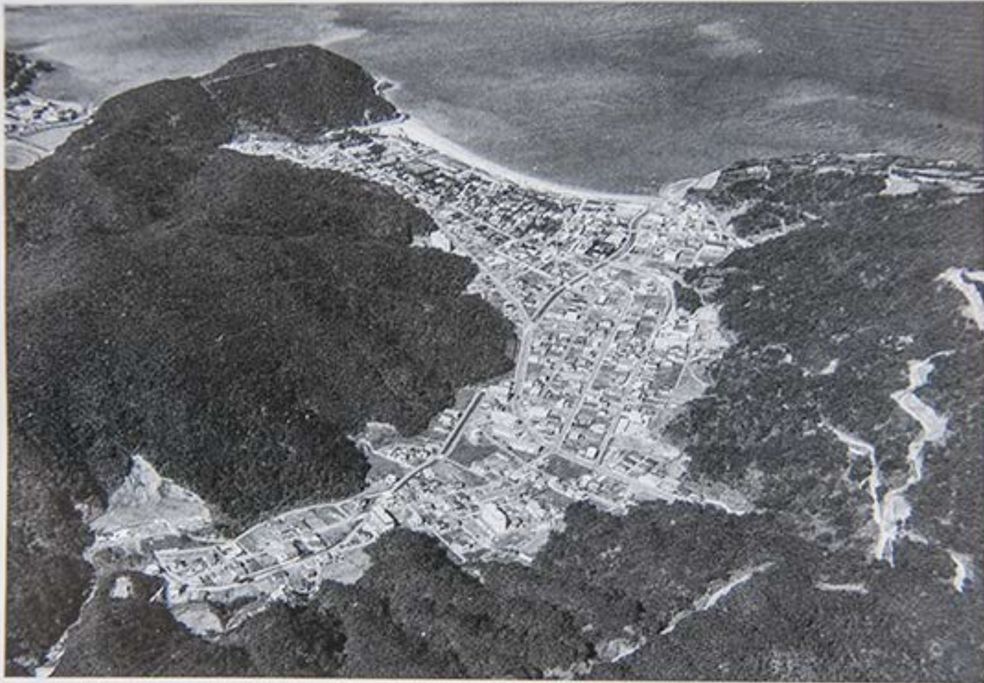
1985 (昭和60) 年頃 市街地化が一段と進む朝仁・朝仁新町