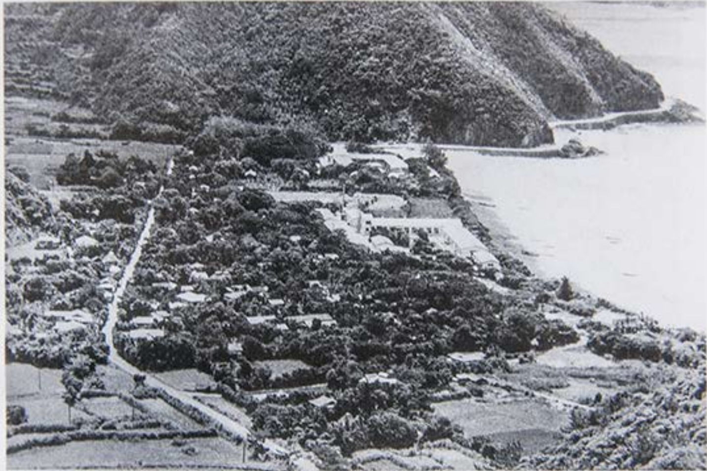
1944 (昭和39) 年頃の朝仁集落 (赤崎公園から)